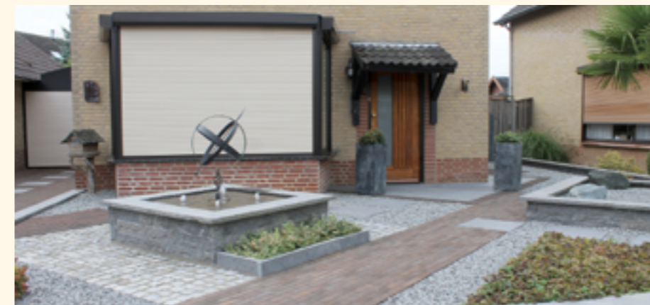
▲ Een minimalistisch tuinlandschap. Mensen nemen vaak hun omgeving als referentiepunt voor hun eigen tuinkeuzes. En die omgeving is helaas maar al te vaak door industriële landbouw sterk verarmd. Het verdwijnen van tuingroen heeft een desastreus effect op de houding van mensen tegenover natuur en landschap

Wie geworteld is in het Land van Cuijk of er op latere leeftijd terugkeert, wil iets voelen dat het best beschreven wordt als 'het thuiskomgevoel'. Een diep geworteld gevoel dat alles te maken heeft met taal en dialect, tra-