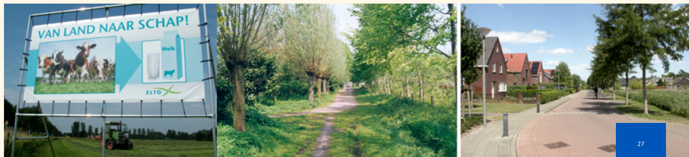
▼ De landelijke Kleine Dijk in Sint Anthonis, in 2004 en nu in 2020. Ook in de toekomst zijn ruimteclaims op het landschap onvermijdelijk