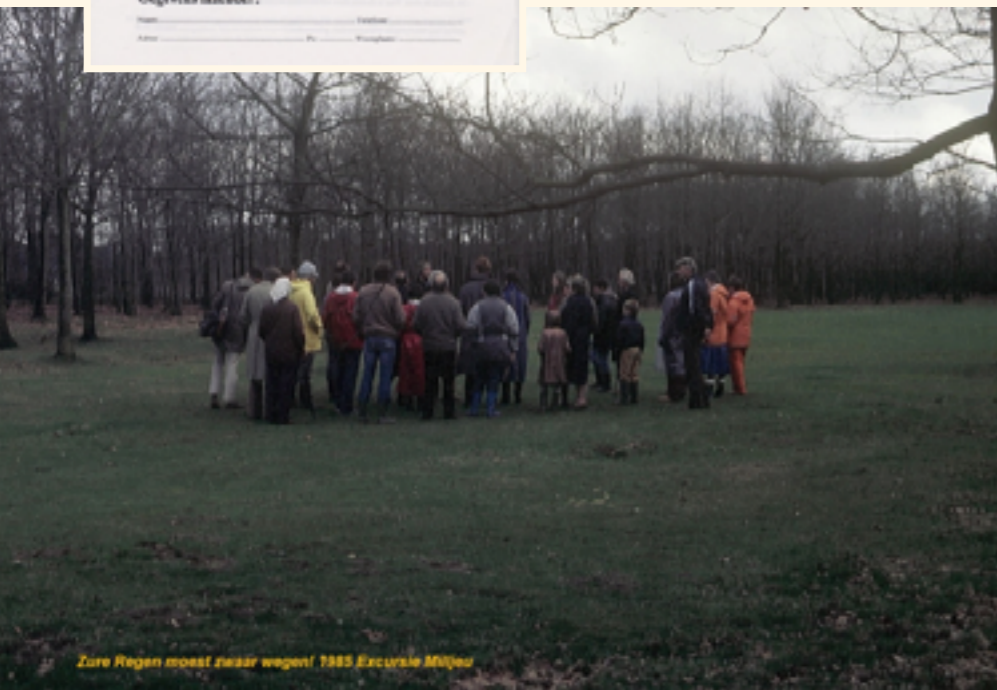
Zure Regen moest zwaar wegen! 1985 Excursie Milljeu