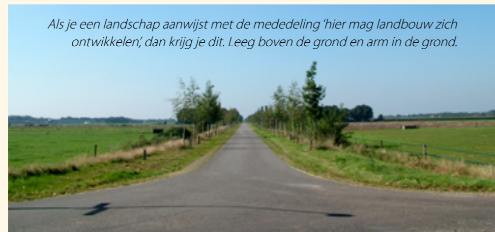
Als je een landschap aanwijst met de mededeling 'hier mag landbouw zich ontwikkelen', dan krijg je dit. Leeg boven de grond en arm in de grond.

Na de ontginning van De Peel kwam de ruilverkaveling die de historische, organische ontwikkeling van het landschap heeft doorbroken. Verbanden, gelaagdheid en het functioneren van de waterhuishouding gingen volledig op de schop. Geschiedenis, streek-eigenheid, schoonheid en ecologisch vernuft, biodiversiteit maar ook de daarmee gepaarde gevoelens van trots en eigenwaarde: dit alles verdween in een paar decennia. En ook dat prikkeldraad was funest voor het bestaande landschap en de natuur.