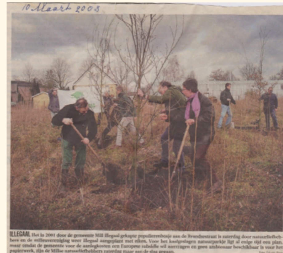
ILLEGAAL Het in 2001 door de gemeente Mill illegaal gekapte populierenbosje aan de Brandsestraat is zaterdag door natuurliefhebbers en de milieuvereniging voor illegaal aangeplant met eiken. Voor het kaalgeslagen natuurschapje ligt al enige tijd een plan, maar omdat de gemeente voor de aanplanten een Europese subsidie wil aanvragen en geen ambtenaar beschikbaar is voor het papierwerk, zijn de Millse natuurliefhebbers zaterdag maar aan de slag gegaan.

Wilt u GRATIS op de hoogte gehouden worden van de laatste regionale natuur- en milieu nieuwtjes?