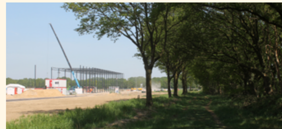
▲ Het landschap verandert. En heel snel. (de foto is van 7 mei 2020). Links oprukkend bedrijventerrein Laarakker aan de A73. Rechts (een restant van) 't Duitse Lijntje

historische maar ook in natuurlijke zin is ons erfgoed zwaar beschadigd. Op enkele fraaie landschapselementen na en grotere stukken natuur (daar 'mogen' de beken weer meanderen) zijn er zo veel sporen uitgewist dat we onze streek niet meer kunnen thuisbrengen. Het is land zonder ziel geworden.