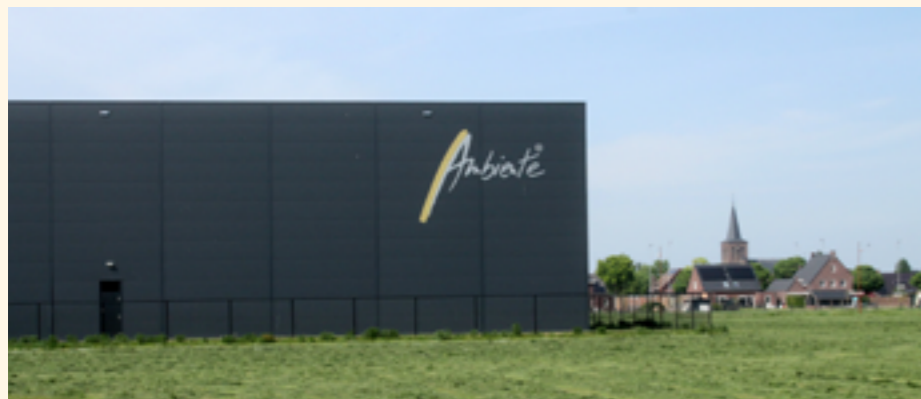
▲ Niet alleen elders ontstaat een 'verdozing' van het landschap en de horizon. Ook nabij Beugen is het zo ver. Dit is een knap staaltje bouwen zonder respect voor het landschap

Wat we wel weten is dat verrommeling van de ruimte een proces is. Dat gaat door als er niets tegen gedaan wordt. En bij het aanpakken van verromme-