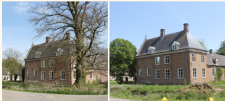
▲ We hebben vaak nauwelijks in de gaten dat ons landschap langzaam achteruit gaat. Soms blijkt er zomaar iets verdwenen: hier een gezonde monumentale boom in Mill

De natuurlijke ondergrond vormt de basis van ieder landschap. Het is belangrijk daar kennis van te hebben.