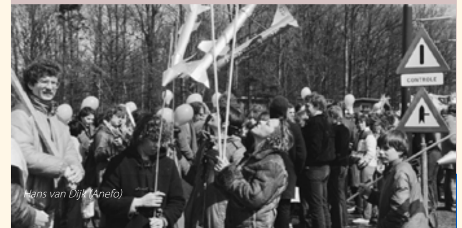
Hans van Dijk (Anefo)