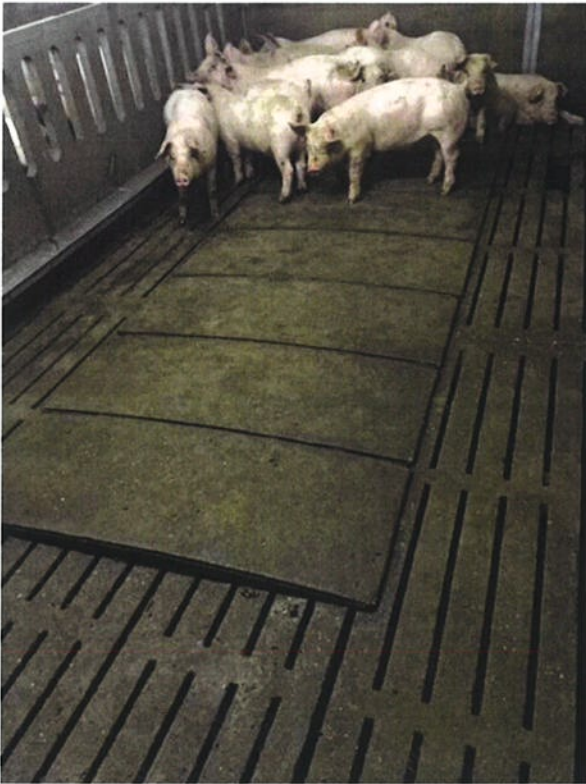
Dit is de afdeling met een gedeeltelijke roostervloer, geheel onderkelderd zonder stankafsluiter.